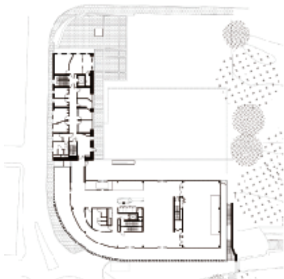
Grundriss Edgeschoss · Ground floor plan